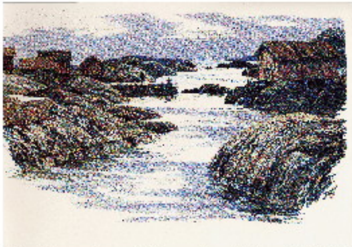
"Fyrfolkets hamn" Litografi av Roland S från 1976 25x40

Efter några timmars vistelse på var det dags för avfärd mot nästa mål: Östersjöns Drottning, fyren Grönskär. För att göra det svårare valde Torbjörn den södra vägen om Storön och rundande "Kap Horn".