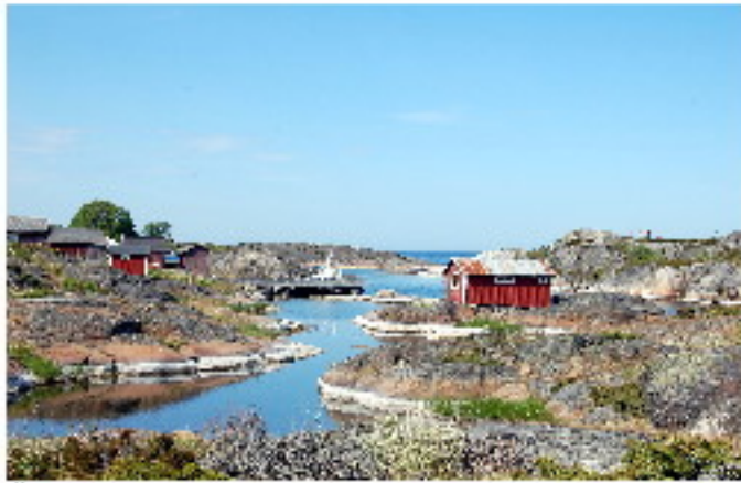
Även denna vy finns som en litografi av Roland S