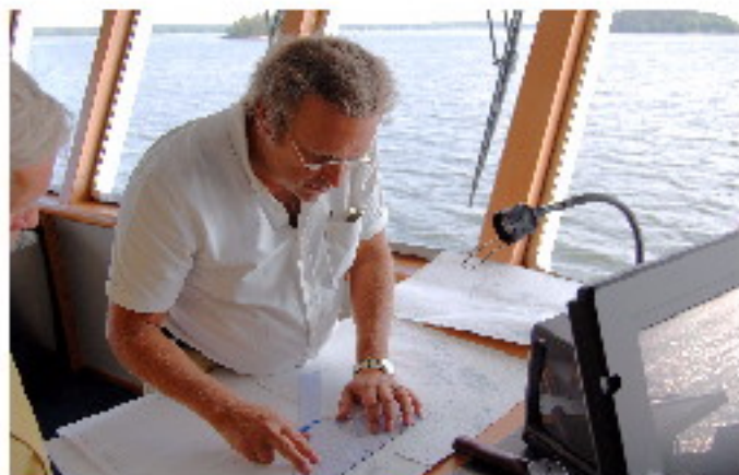
I Torbjörns värld används fortfarande sjökort och bestick.